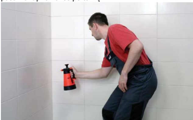
Ka tik užpildytos siūlės apipurškimas vandens ir muilo tirpalu

Per 5 minutes užpildomą vietą reikia apipurkšti vandens ir muilo tirpalu bei išlyginti ta pačia priemone suvilgytu įrankiu, pašalinant priemonės perteklių.