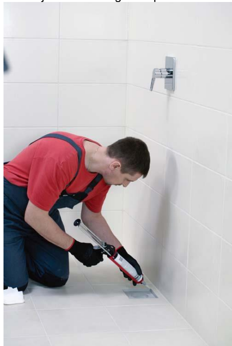
Nuotekų grotelės žiedo sandarinimas

Jei naudojote, nulupkite lipniąją juostelę. Šviežias silikono dėmes reikia nuplauti muiluotu vandeniu arba petroleteriu, sukietėjusias dėmes galima pašalinti tik mechaniškai.